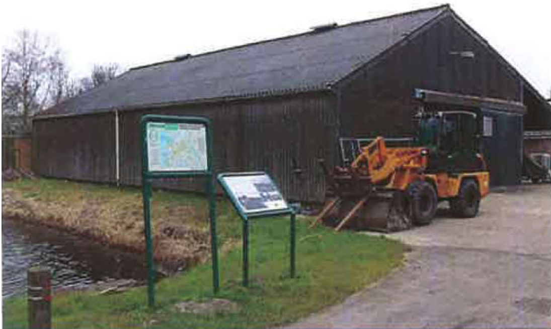
Afbeelding 4: Foto bestaande situatie

In de huidige situatie is het plangebied voor het overgrote deel verhard en bebouwd. Er staat een schuur van circa 420 m 2 met asbestplaten, dat oorspronkelijk als koelcel voor agrarische producten werd gebruikt. Thans vindt er opslag van goederen en caravans plaats.