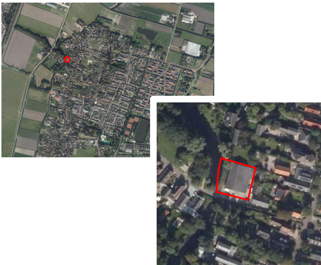
Afbeelding 2: ligging plangebied

Het plangebied is gelegen aan de westzijde van Sint Pancras. De locatie is gelegen aan het begin van het Daalmeerp pad dat aansluit op de Benedenweg. De locatie grenst aan de westzijde aan een brede waterloop en wordt verder omgeven door bestaande woningen.