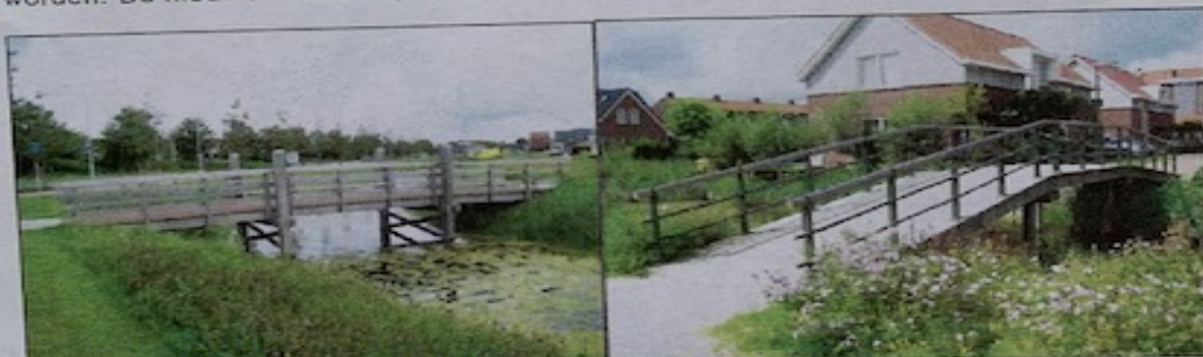
Referentiebeelden nieuwe brug ter plaatse van de Achterburggracht.

De ontsluiting van het Oxhoofdpad wordt gewijzigd. De brug die in de huidige situatie de auto-ontsluiting vormt wordt vervangen door een brug die geschikt is voor langzaam verkeer . De nieuwe brug zal een eigentijdse verbinding met de dorpsstraat moeten worden. De nieuwe ontsluiting voor het gemotoriseerd verkeer loopt via de Meeuw.